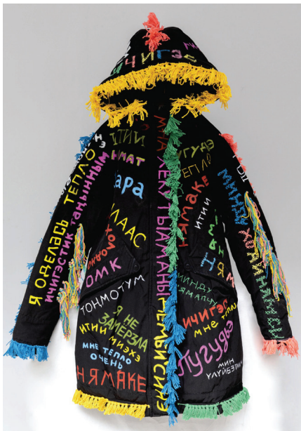
Ушницкая Л. «Северная азбука тепла» // (выставка «Человек Снежный», 2022 г.).

В основе колористической гаммы вышитых слов и выражений, связанных с теплом, лежат основные цвета, демонстрирующие связь северных сообществ с природным окружением Арктики, где в традиционной картине мира народов Севера белый и голубой — цвета Зимы (снег, лед, зимнее небо), красный, зеленый и желтый — цвета Теплоты (Солнце, зелень). К примеру, белый цвет у жителей холодных территорий ассоциируется с цветом белого искрящегося снега, он содержит семантику чистоты, чистого зимнего воздуха. Так, лингвисты отмечают широчайший диапазон обозначений белого цвета и его оттенков у эвенков и эвенов и связывают это с преобладанием у них слов, обозначающих общее понятие «снег», что говорит о значимости и актуальности данного объекта Холода в хозяйственных и символических практиках народов Севера. В одном только Русско-эвенском словаре дано 24 слова под понятием «снег» (Цинциус, Рихес 1952: 573). А исследователь эвенкийского языка А.Н. Мыреева в свое время отметила у эвенков более 50 названий снега (Мыреева 2003).