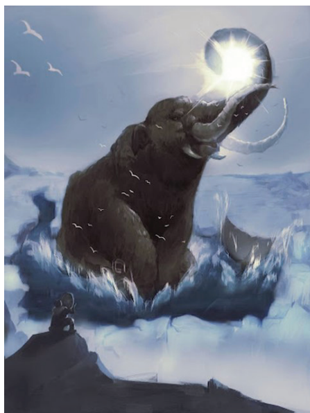
Николаева Г. «Мифы северных народов о мамонте как творце холодной земли»

Зарождение мифов о мамонте относится к глубокой древности. Представления об этом загадочном звере играют существенную роль в духовной культуре коренных сообществ, населяющих холодные территории, и являются частью их этнического наследия. Так, в мифологических построениях северных народов распространен сюжет о сотворении Земли, где божества создают Землю, а мамонт выступает творцом природного рельефа (горы, озера, река), что воспроизведено в проекции «Мифы северных народов о мамонте как творце холодной земли» (автор Г. Николаева, Амгинский улус).