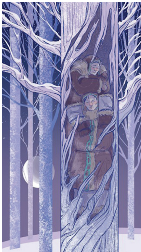
Яковлева А. «Тоц биистэр»

В якутской картине мира Зима воспринималась как календарное время символического умирания, когда вокруг все затихает и впадает в спячку. В фольклорной традиции якутов известны сюжеты о людях, которые зимою, «когда из носа опускались вниз сосульки, умирали, весной же, когда льдинки оттаивали, воскресали» (Романова, Добжанская 2019: 256).