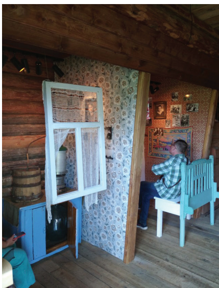
Рис. 8. Экспозиция «Своя лодка. Старухи о любви». Учма. 4.08.2024

В самом деле, при входе в амбар посетитель сперва слышит общий гул, состоящий из нескольких женских голосов, а, заходя внутрь комнат, оказывается наедине с каждым из них, вступая тем самым в персональную коммуникацию с конкретной героиней (Рис. 8). Таким образом, перемещаясь по выставке, посетитель переключается между общим и частным пространствами и режимами коммуникации, и это постоянное переключение (предваряемое приведенными словами экскурсовода) позволяет проблематизировать соотношение индивидуального и коллективного в представляемой на экспозиции деревенской жизни. Такая морфология выставочного пространства, поддерживающая эту проблематизацию, на мой взгляд, сама по себе является эффективным и изящным техническим и этическим решением.