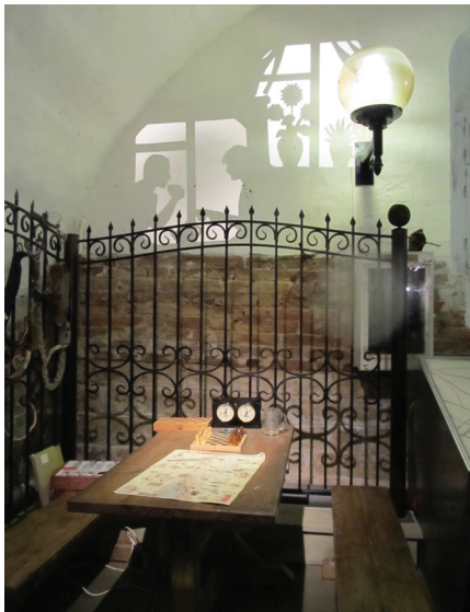
Рис. 7. Силуэты на экспозиции Музея «Огни Москвы». 7.03.2024 г.

Таким образом, человеческий силуэт в краеведческих проектах — это способ «приручения» индивидуальности и одновременно компромисс между антропологической установкой, требующей введения в музейное пространство человека, и структурными ограничениями, налагаемыми музейной и краеведческой рамками. Он — продукт и символ музейного движения к человеку — и его постоянного избегания, потребности в нем — и невозможность ее реализовать в полной мере. Более того, силуэт, как кажется, обнажает более основательное противоречие, присущее далеко не только музейной практике, но и антропологии в целом: между декларируемым фокусом на человека и стремлением уловить не уникальное, а универсальное, общее, типичное.