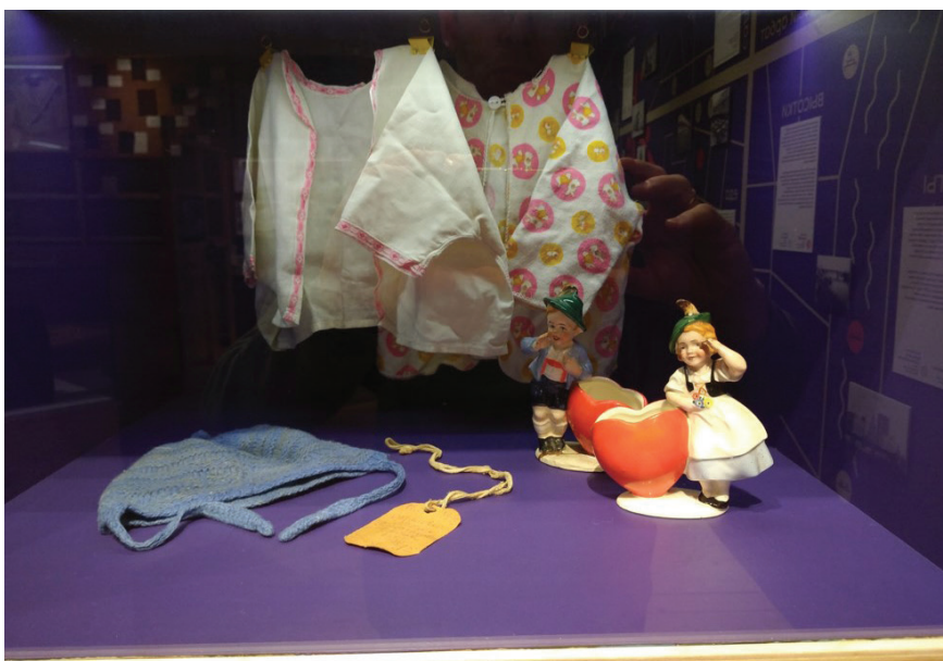
Рис. 3. Распашонки и фигурка пастушки на выставке «Москва без окраин. Арбат». 16.11.2022 г.