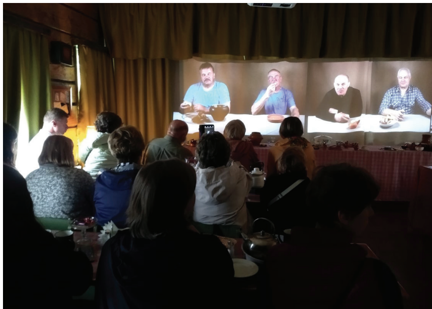
Рис. 5. Демонстрация видеоспектакля «Охотинские. Мужской род». Учма, 3.08.2024 г.

голикое и многоголосое, но единое и нерасчленимое сообщество, в котором индивидуальность если не утрачивается полностью, то сильно «растворяется». И это его свойство исключительно точно отражается в названии проекта, не просто обозначающем локальный характер сообщества, но и подчеркивающим одновременно и его множественность, и однородность: «Охотинские. Мужской род».