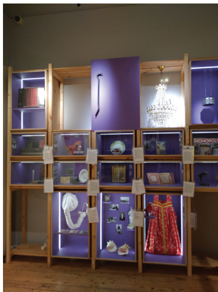
Рис. 4. Монтировка на выставке «Москва без окраин. Очаково-Матвеевское».

вается в его пространстве, выстраивается в один ряд и оборачивается одной стороной — становится местным . Таким образом, в краеведческих проектах происходит перекодирование индивидуальной памяти — в историю места. В семиотической парадигме это можно описать как смену означаемых: элементы индивидуальной памяти «изымаются» у человека и присваиваются месту, становятся его атрибутами.