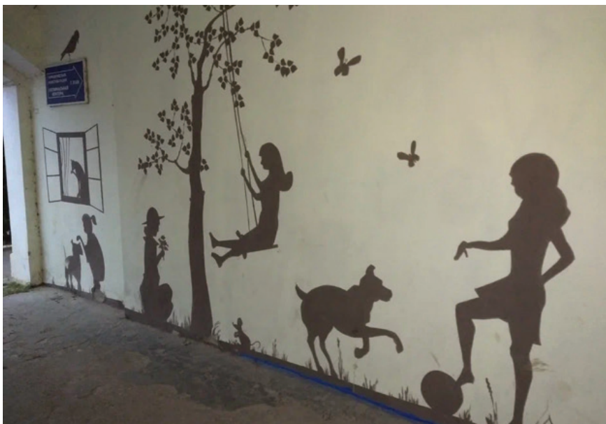
Рис. 6. Силуэты в городской подворотне. Таруса.

альной репрезентацией города. Изображение обезличенных силуэтов типичных местных жителей за типичными местными занятиями — эффектное (и, вероятно, эффективное) средство конструирования образа места и локальной идентичности.